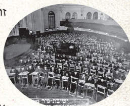
ישיבת מיר בשנחאי

תנועת המוסר: כמה שנים לאחר מכן החלה להתפשט תנועת המוסר, אותה ייסד מרן הרב ישראל סלנט, שאומצה בידי מרבית הישיבות הליטאיות. מטרתו היתה להחדיר את הצורך שבן ישיבה ילמד ספרי מוסר, בכדי להתחזק ולדרוש מעצמו להתקדם ולהתעלות עוד ועוד בעבודת השם. שיטה זו עיצבה את צורת התנהלות הישיבות הנהוגה כהיום, ואת 'סדר מוסר' בישיבות, ו'שיחות מוסר' ו'וועדים' שמוסרים המשגיחים.